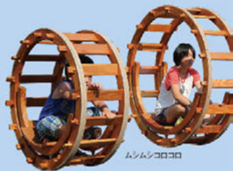
ムシムシコロコロ

今年で4回目の開催となる、テラヤマ・ワールド in 青森屋/寺山修司演劇祭2016。「寺山修司遊びの劇場」と題して1日だけの開催です。「旧渋沢邸ガイドツアー」や子どもから大人まで楽しめる企画をご用意しました。楽しいひとときをお過ごしください。